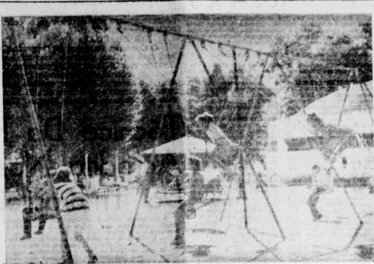
MUNDO DE ALEGRIA

Crianças das mais variadas idades, diariamente, acorrem ao Parque Infantil do Passeio Público. Transformam o local num mundo de alegrias, brincando e saltitando, às vistas dos seus responsáveis. A Prefeitura está projetando construir outros logradouros idênticos, onde, além do divertimento, os petizes receberão orientação educacional.