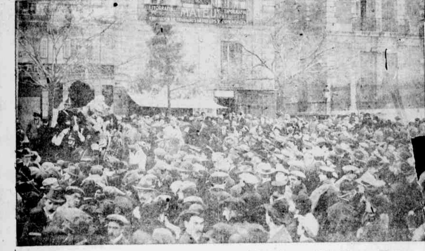
Momentos depois do attentado contra o rei d. Afonso XIII. O povo que presenciou o crime, cercando o soberano, prorompe em delirantes acclamações a S. M.

escapar a sorte que a aguarda, si a alliança dos Estados bálticos continuar firme.