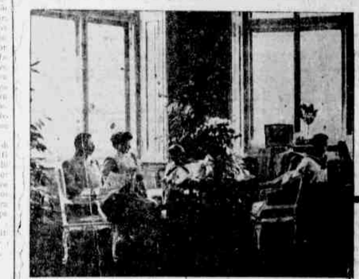
O archiduque Francisco Fernando, herdeiro da coroa da Austria, e sua familia. O archiduque que é chefe do partido militar no seu país, onde é considerado um fervoroso adepto da guerra.