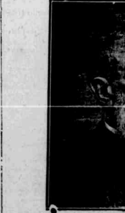
Coronel Antonio O' de Almeida

José Joaquim de Andrade Neves—o bravo dos bravos—nascou no Rio Grande do Sul, em 22 de janeiro de 1807, combatendo em bravura os revolucionarios riograndenses, em 1835. Na guerra do Paraguay brilhou de um modo assombroso, a frente da cavalleria riograndense, celebrando-se na batalha de "Tijucal" levando os paraguayos derrotados até Humayta. O nome de Andrade Neves causava horror entre as tropas de Solano Lopez, que chama-