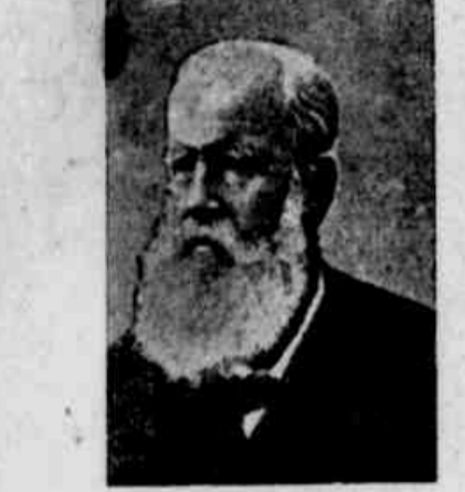
D. Pedro II

carão alvorada junto a estatua do General Gurjão, percorrendo em seguida a cidade. A's 8 horas alli devem encontrar-se, a convite do Instituto, os escoteiros, collegios officiaes particulares, grupos escolares, etc., que reúnidos ás praças de folga das corporações militares, ao iniciar-se a cerimonia, cantarão o Hymno Nacional e ao termino o Hymno da Republica, desfilando em seguida, entoados canções patrióticas. Palavrã junto a estatua um representante da Associação da Imprensa. Por ocasião da passagem do prestito em frente a casa em que nasceu Gurjão fará alta memoria de assistir a inauguração de uma lapide commemorativa. A's 8 horas da noite o Instituto Historico celebrará uma sessão solenne no Theatro da Paz, fallando por esse occaõão o dr. Luiz Estevão, membro do mesmo Instituto. Tovarão durante o acto as bandas de musica do 25º e da Brigada. A Companhia de Metralhadoras, estendida para os fins do largo de Palacio, salvarã as 6 horas da manhã, 1 e 6 da tarde. A commissão convidou muito especialmente para as ceremonias de hoje os veteranos do Paraguay, que conduzirão e montarão guarda a uma das bandeiras levadas a guerra e que se acha depositada na Cathedral.