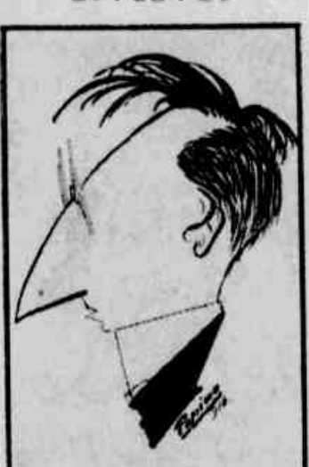
No «Parque»: V. B.