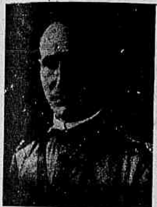
Tenente-coronel João Monteiro do Rosario

tiu no dia 16 de Julho do anno findo e que até agora se conservou, combatendo heroicamente contra os bandos revolucionarios que desde de 5 de Julho, perturbam a ordem e a tranquillidade da Republica.