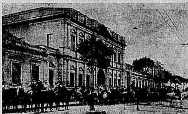
Quartel da Força Militar

Soldado disciplinado e obediente as leis da Republica, mereceu pelos relevantes serviços prestados na hora dolorosa em que as instituições