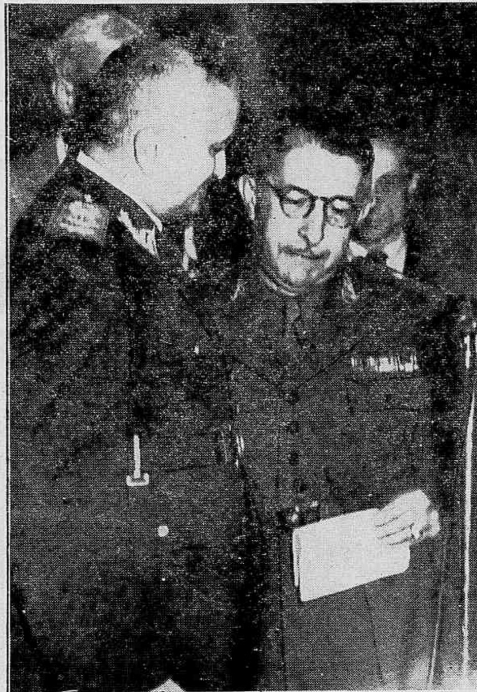
O chefe da Força Expedicionária Brasileira, General Mascarenhas de Moraes, ao lado do Sr. Ministro da Guerra.