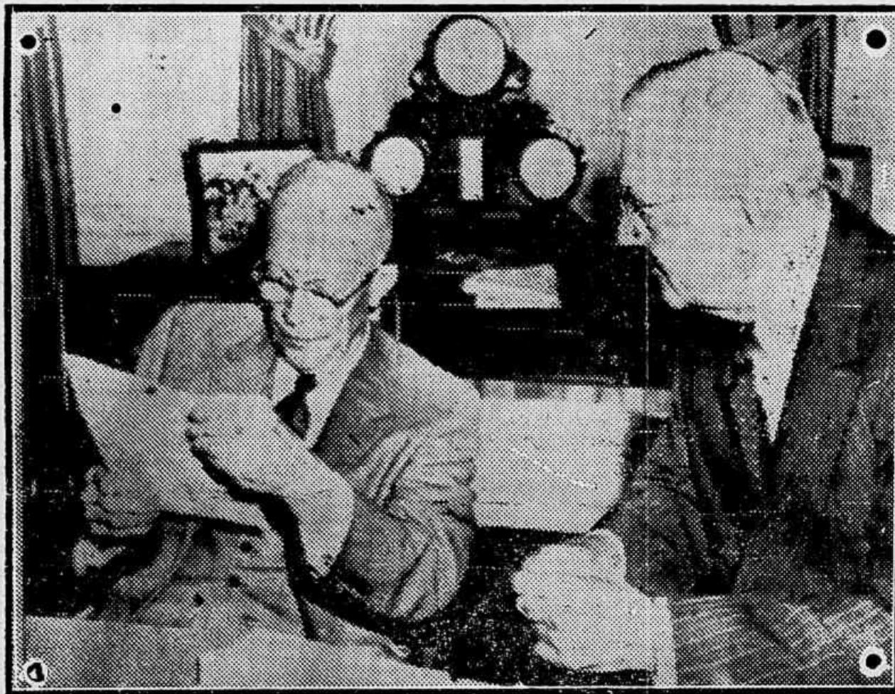
Flagrante tomado no momento em que o Presidente Eisenhower, assessorado por Foster Dulles, abria a Conferência dos Presidentes Americanos, no Panamá.

por forças totalitárias, alheias à tradição de nossos povos e às suas instituições, a América mantém o designio