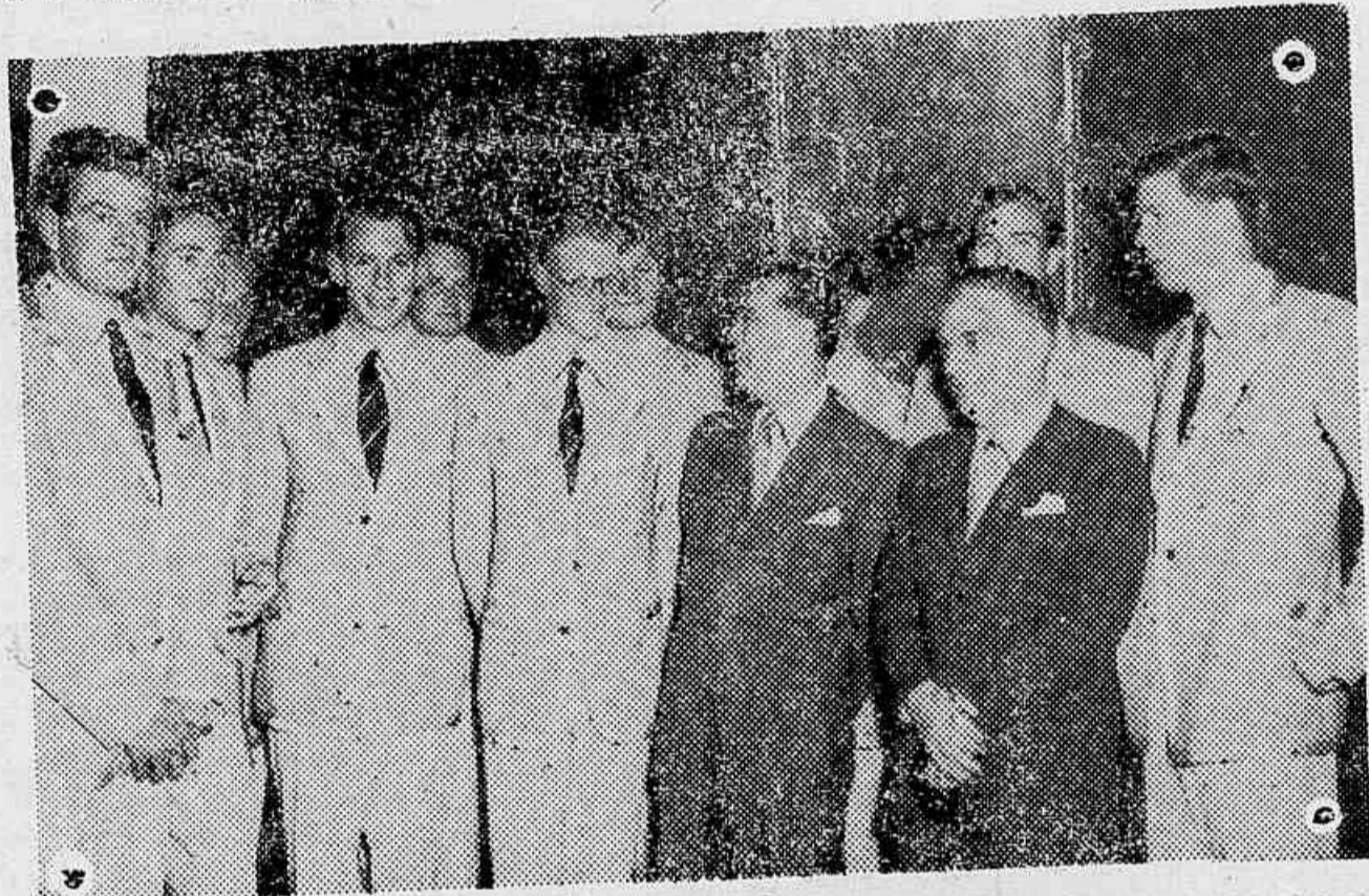
Os Estudantes do Cambridge University Rowing Club, campeões da Regata Internacional, promovida pelo 'Jornal dos Sports', em visita ao Presidente Juscelino Kubitschek

Para ter direito à compra por 75 mil cruzeiros, do barco, no qual correm is universitários ingleses de Cambridge, correrão breve, os «oito» do Vasco, Flamengo e Botafogo, em disputa da preferência.