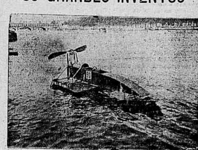
Um novo systema de barco automovel, experimentado nas aguas do Sena

Ha poucos dias ainda, em um dos numeros do "Paté-Journal", exibido em nossos cinemas, num concurso de barcos-automoveis, disputado no Sena, era-nos mostrado a embarcação acima.