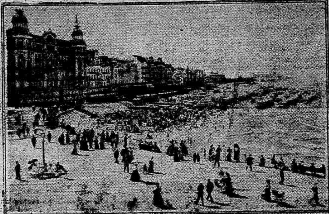
Ostende e a sua maravilhosa praia de banho—Ler o telegramma de hoje sobre a batalha entre Ostende e Lille.