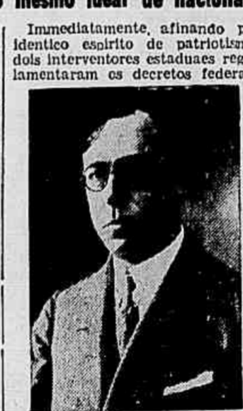
Interventor Nereu Ramos

O problema da nacionalização das zonas brasileiras que soffrem a influencia de colonizações estrangeiras como no Espirito Santo, São Paulo, Paraná, Santa Catharina e Rio Grande do Sul é desses em que precisamos entrar de corpo e alma, afim de refazermos aquillo que governos passados deixaram crescer numa displencia criminosa por todos os aspectos. Não podemos continuar a fechar os olhos diante de factos máos do que positivamente, achando que no fim tudo dá certo, pois isso seria de consequências desastrosissimas em tempos futuros que talvez não estivessem muito longe. O sr. Getulio Vargas pôde se gabar de ter sido o primeiro chefe da Nação realmente preocupado com o problema e como é sabido, em solução do mesmo, tomou as providencias mais energicas, substanciadas essas em decretos que são verdadeiros monumentos de brasilidade.