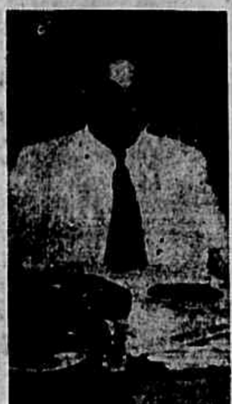
Capitão Faria Lemos

— "Não gosto de narrações no papel — disse aquelle official — mas quero ser um "documento vivo", afim de prover ás necessidades que se me depaerarem. "Do Recife", viajei de automovel, pelo interior, até o Rio Grande do Norte. All, em virtude de máa condições das estradas de rodagem,