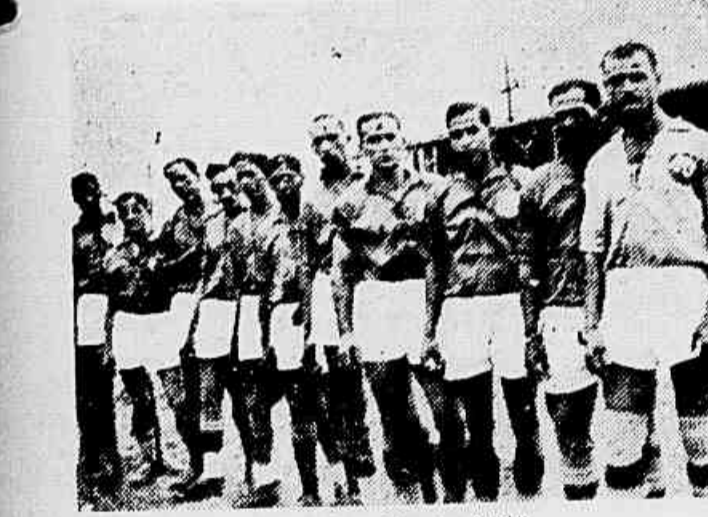
A "Maravilha do Cajú"

China commandará a orientação tecnica da "Maravilha do Cajú" — Um succulento angú para reconfortar a turma