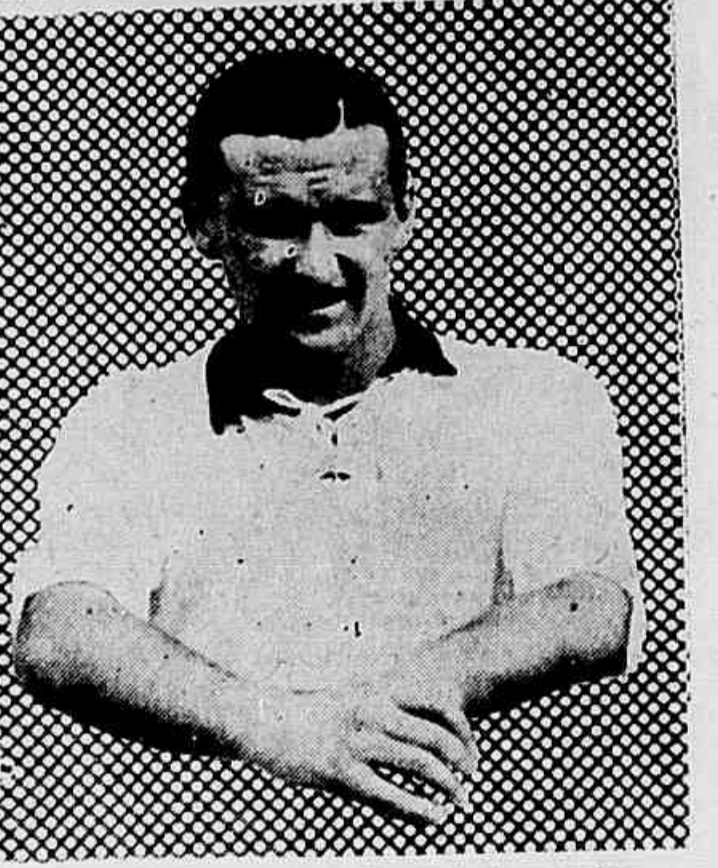
Villegas que vae passear e fazer mais alguma cousa

PARAHYBA DO SUL (Do correspondente) — O Club dos Millionarios festa cidade que vem realizando interessantes partidas amistosas e excursões pelo interior do Estado, hoje, jogará match revanche com o Miguel Pereira F. Club. No jogo realizado domingo ultimo o club de Maximalino perdeu pelo score de 2x1, goal de victoria obtido pelo proprio zagueiro dos Millionarios. Junto á delegação seguiu um juiz e um redactor do jornal de Parahyba do Sul.