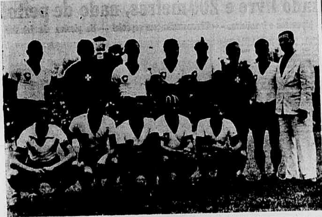
A equipe nacional que hoje de frontará o scratch argentino, no campo do Palestra, em S. Paulo