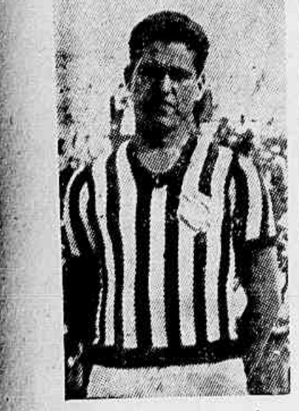
O zagueiro Camarão, embora "pesado no corpo" é leve nas jogadas e ainda figura na linha dos bons

Festa social e desportiva, com longo programma