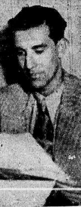
China, o conhecido conductor do "Trem Azul"

Fantasma — Marques — Alberto — Herculano — Carestia — Mulambo — Mosquito — Nunes — China — Mario — China — Allyrio — Veneno — Rulsirho.