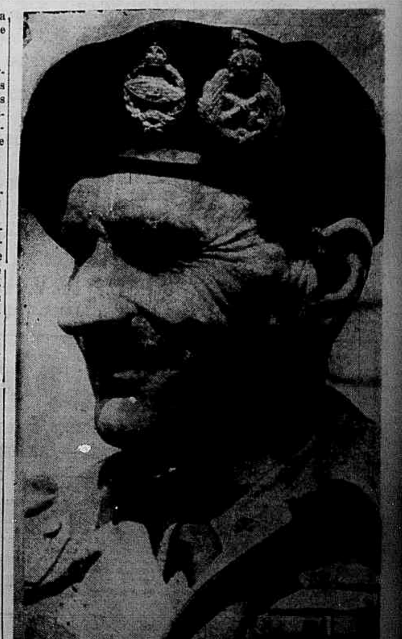
Montgomery, comandante do 8º Exército Britânico, que já ocupou toda a Calabria

NOVA YORK, 9 (United Press) — Poderosos Exercitos britânicos, norte-americanos e canadenses estão desembarcando em vários pontos do coração da Itália.