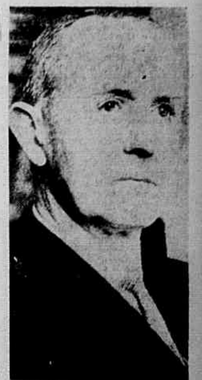
Almirante Andrew Cunningham, comandante da esquadra britânica no Mediterraneo

Q. G. ALIADO EM ARGEL, 9 (U. P.) — Urgente — Um comunicado especial anuncia que já se iniciaram novas operações em solo italiano, em Nápoles