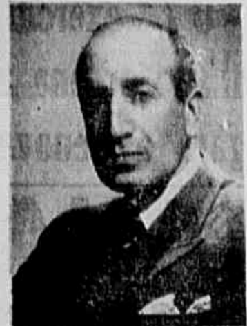
Chanceler Fernandez y Fernandez

O Departamento de Educação Física da Marinha recebeu ontem a visita do chanceler J. Fernandez y Fernandez, O ministro das Relações Exteriores do Chile, que no