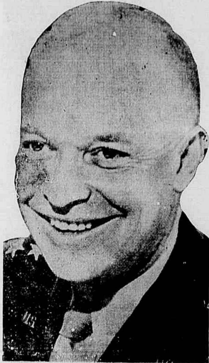
General Eisenhower que assinou o armistício á Italia em nome das Nações Unidas

Q. G. ALIADO NA ARGELIA, 8 (United Press) — Foram as seguintes as palavras do general Eisenhower, dirigidas ao mundo, quando anunciou a rendição incondicional da Italia.