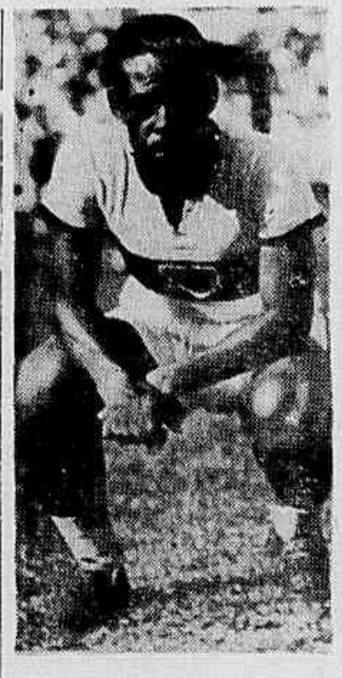
Médio — que treinou entre os banguenses — onde se sagrou campeão carioca de mil novecentos e quarenta e três