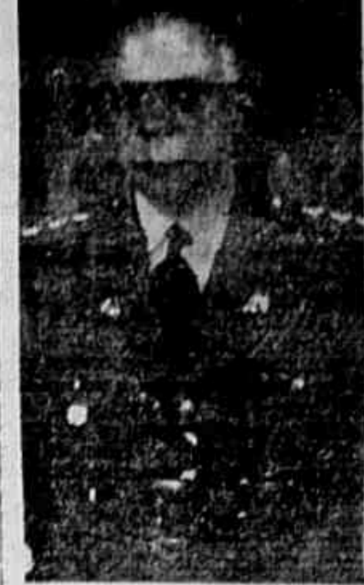
Coronel Americo de Menezes

Ilustre engenheiro militar assim nos responde: