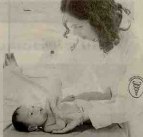
Atendimento é feito nas segundas

O Ambulatório de Fisioterapia Pediátrica da UCS oferece novo e exclusivo serviço na região. Trata-se do acompanhamento do desenvolvimento de bebês, inclusive prematuros, de crianças e adolescentes, assim como os que apresentam alterações cinético-funcionais: de postura, de respiração, doenças ortopédicas ou qualquer disfunção psicomotora. O ambulatório vem recebendo clientela singular e de forma gratuita. São crianças que precisam de estímulo para seu desenvolvimento neuropsicomotor, (re)aprender exercícios respiratórios para evitar ou amenizar crises de asma e adolescentes que apresentam dores ou problemas na coluna vertebral, por exemplo.