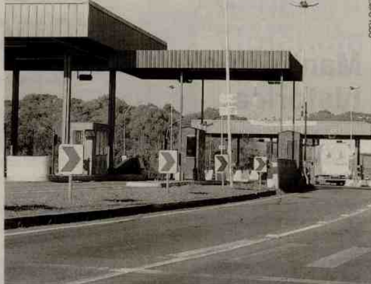
Manifestação na praça de pedágio é mais uma forma de pressão sobre o governo

Fora todos os problemas históricos, o secretário-execu-