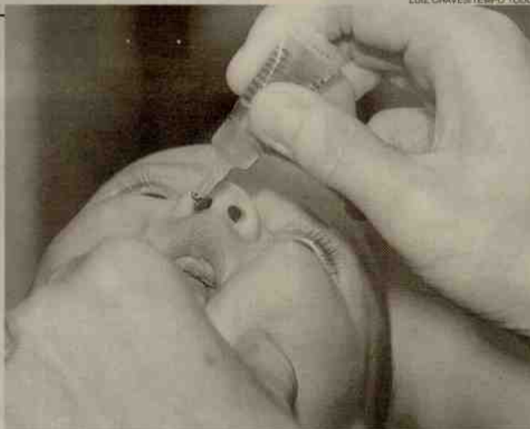
Número de imunizados no sábado ficou abaixo do esperado