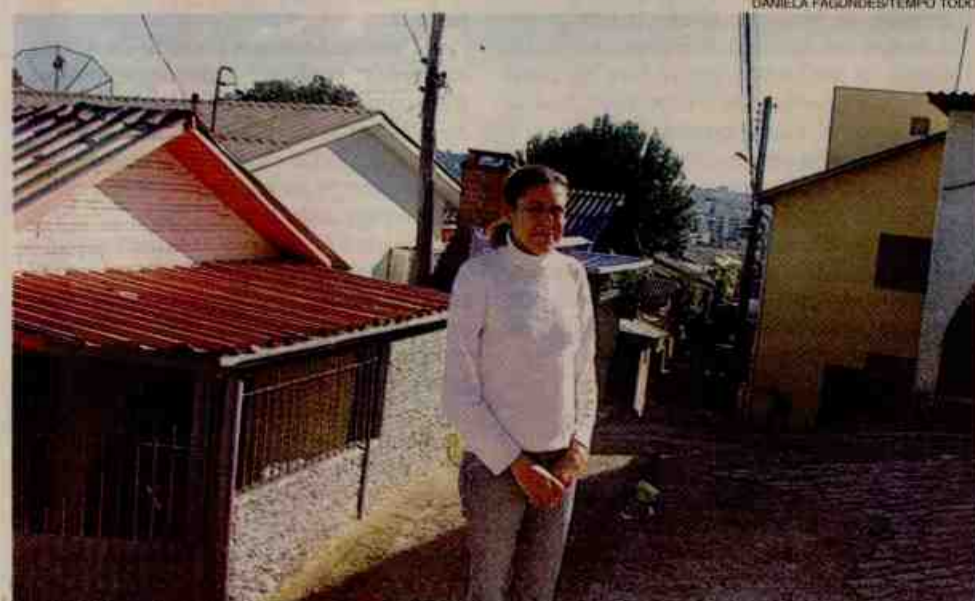
Josi luta pelo fim do preconceito entre os próprios moradores

alargamento das ruas e abertura dos becos. "Em alguns locais, as ambulâncias e carro de bombeiros não têm acesso. Isso gera dificuldades nos casos de emergência".