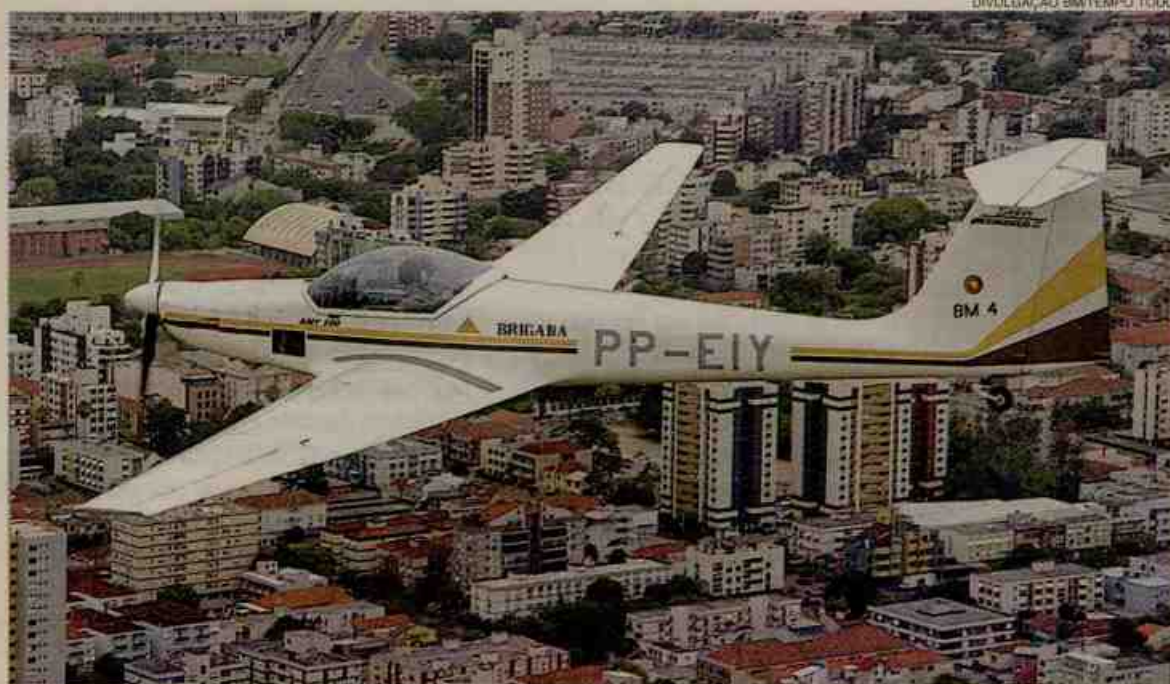
Aeronave Ximango deverá permanecer na cidade até liberação de outro avião

A partir de quarta-feira, um avião Ximango dará o suporte necessário para o início das operações experimentais do policiamento aéreo em Caxias. Neste dia, uma comitiva do comando do Batalhão de Operações Especiais de Porto Alegre estará na cidade para oficializar a implantação do Grupamento de Polícia Militar Aérea. Página 13