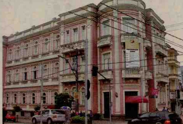
Sede atual começou a ser construída a partir de 1925