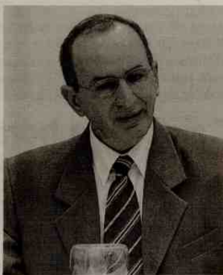
Müller: erro histórico

Mais uma entidade da sociedade civil aderiu à campanha contra a prorrogação do contrato de concessão das estradas pedagiadas do Estado. A CIC de Caxias do Sul está empenhada em mobilizar o governo do Estado a manter os contratos com o vencimento em 2013, como havia sido concebido e, após este período, transformar os pólos rodoviários em pedágios comunitários. Enquanto o governo não expõe o seu novo projeto, a entidade representativa dos empresários caxienses segue fazendo lobby para que os 55 deputados estaduais rejeitem qualquer proposta que venha propor a ampliação do prazo para a explo-