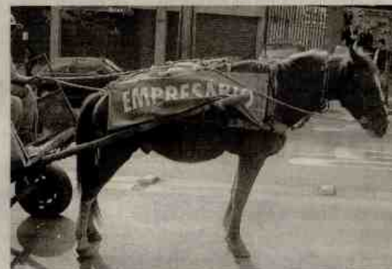
Cavalo representou a classe empresarial

O protesto também teve seu lado cômico para reforçar a inconformidade dos participantes. À frente do caminhão de som, dois burros envoltos por faixas contra a carga tributária, pastaram