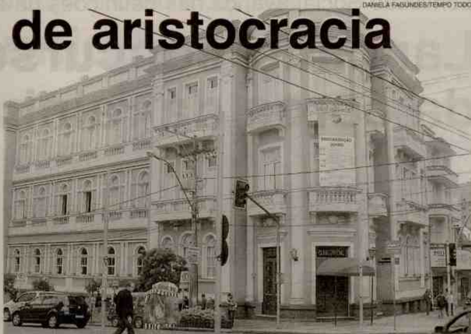
Atual sede foi construída em etapas a partir de 1925

Para comemorar o centenário, o Departamento Cultural buscou parcerias que contemplam as artes visuais, a música, a literatura. Neste sábado, acontece o Baile do Centenário, com início programado para 21h30, animado pela banda Inovação. Na quinta-feira, dia 23, haverá sessão solene na Câmara Municipal.