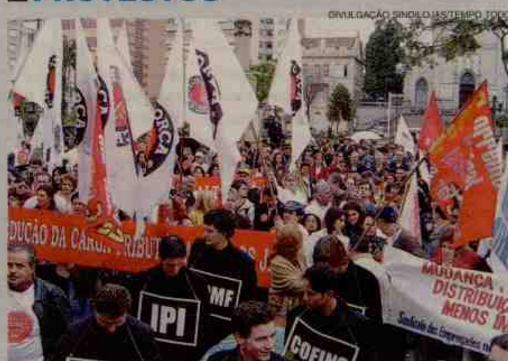
Trabalhadores e empresários se uniram contra o governo